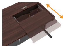
■スライド天板装備