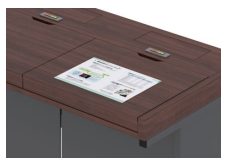
■A3サイズの設置が可能