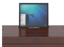
■天板上でボタン操作