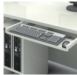
GES-KB 有効内寸：W545×D185×H46 (mm)