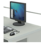
GES-18T・16T・14T・12T・06T H200 (mm)