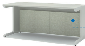
GES-18HQ、16HQ、14HQ、12HQ ※ホルムアルデヒド吸着・低減パネル 画像は16HQとなります