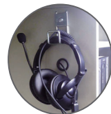
ヘッドセット専用フック付