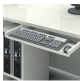
GMK-KB 有効内寸：W545×D185×H46 (mm) 価格：オープン